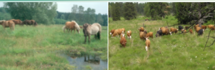
Abb. 1: Die Beweidung mit Island-Pferden - fast ausschließlich 2-4-jährigen Hengsten, die in der Regel ein bis zwei Sommer im Hühnerfeld verbringen - wurde 1993 begonnen. Von 1997 bis 1999 weideten auch Rinder (Heck-Rinder, Rotes Höhenvieh) im Gebiet. 2005 wurde eine Rinderbeweidung mit einer gemischten Herde auf Teilflächen erneut aufgenommen.

Sekundärsukzession durch Brache: Die endgültige Aufgabe der landwirtschaftlichen Nutzung in den 1950er Jahren löste eine Sekundärsukzession aus, die zur Dominanzbildung von brachezeigenden Pflanzenarten und zum Aufkommen von Gehölzen in Teilbereichen führte. Zudem waren bereits seit den 1920er Jahren Teile des Gebietes mit Fichten und Wald-Kiefern aufgeforstet worden. Eine Ende der 1980er Jahre durchgeführte floristisch-vegetationskundliche Bestandsaufnahme mit Vegetationskartierung (EGGERS 1987) ergab, dass ausgedehnte artenarme Dominanzbestände von Adlerfarn ( Pteridium aquilinum ) und Pfeifengras ( Molinia caerulea ) auf weiten Flächen vorherrschten und sich weiter ausbreiten drohten, während konkurrenzschwache, lichtliebende Pflanzenarten zunehmend in ihrem Bestand gefährdet waren. An den historischen Wirtschaftsweisen orientierte Pflegemaßnahmen erschienen somit dringend erforderlich.