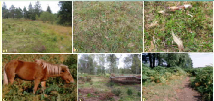
Abb. 2: a) beweideter Pfeifengras-Rasen (links) und unbeweidete Kontrollfläche (rechts, außerhalb des Zaunes); erkennbar sind Unterschiede in Struktur und Artenzusammensetzung. b, c) beweidete Borstgras-Rasen. Gefördert werden kleinwüchsige und konkurrenzschwache Arten wie Arnica montana , Carex panicea und Polygala serpyllifolia . d) Island-Pferde gehören zu den wenigen Nutztiere, die Adlerfarn fressen. e) Adlerfarn-Kontrollflächen heben sich deutlich von ihrer beweideten Umgebung ab. f) Die Auflichtung von Adlerfarn-Dominanzbeständen durch die Island-Pferde beginnt an den Bestandesrändern oder - wie hier - im Bereich von Trampelpfaden, die durch die Pferde entstanden.

Als Erfahrungswert hat sich im „Hühnerfeld“ eine Besatzdichte von ca. 1,6 GV/ha (= 2 Pferde bzw. 1,6 Rinder pro ha) bei einem dreimonatigen Beweidungszeitraum bewährt.